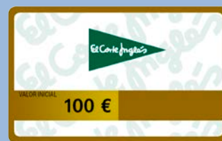
Tarjeta El Corte Inglés valor de 100 €