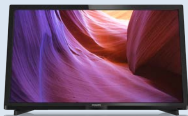
TV 24" Full HD Philips

Tan fácil es domiciliar su nómina en Deutsche Bank como elegir entre 1 :