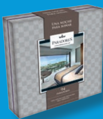
Pack Paradores: alojamiento y desayuno para 2 personas