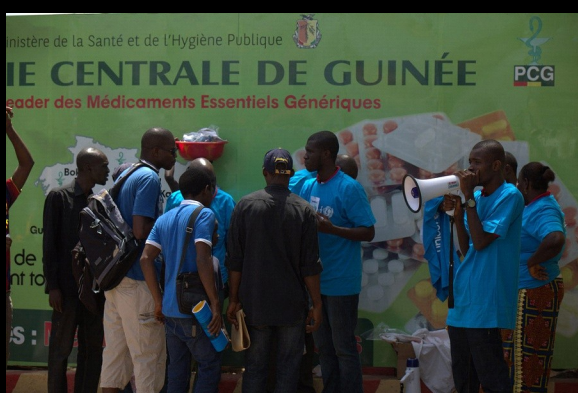
UNICEF y organizaciones asociadas informan a la población en Guinea de cómo combatir el brote de ébola