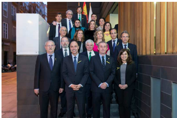
Autoridades asistentes al acto de toma de posesión