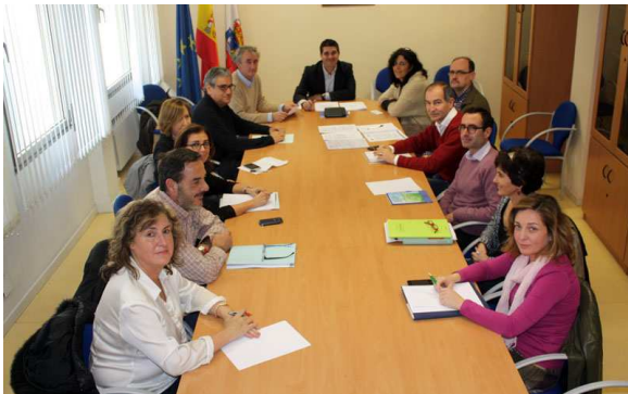
La comisión de violencia en el trabajo sanitario durante su primera reunión.

Bajo la presidencia del gerente del SCS, este órgano cuenta con la participación del Colegio de Médicos y el de Enfermería, los sindicatos, y personal de Riesgos Laborales de Atención Primaria y Especializada