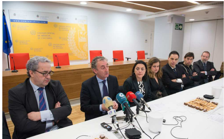
Presentación de omisión de Violencia en el Trabajo Sanitario.