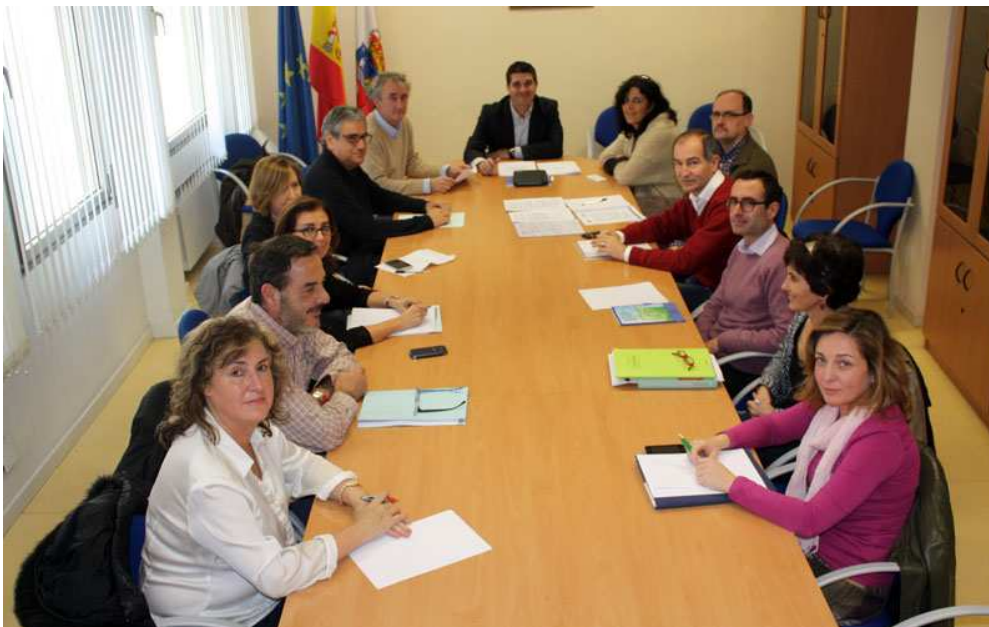
La comisión de violencia en el trabajo sanitario durante su primera reunión.

Bajo la presidencia del gerente del SCS, este órgano cuenta con la participación del Colegio de Médicos y el de Enfermería, los sindicatos, y personal de Riesgos Laborales de Atención Primaria y Especializada