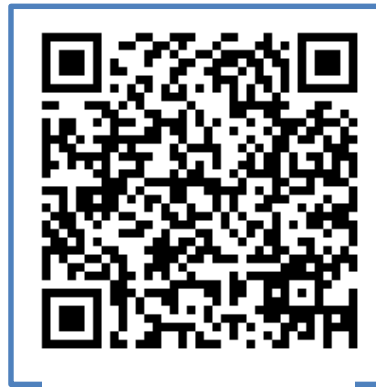
QR al procedimiento

https://www.mscbs.gob.es/profesionales/saludPublica/ccayes/alertasActual/nCov-China/