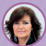
Carmen Calvo Poyato

10.00h INAUGURACIÓN: Carmen Calvo Poyato, presidenta de la comisión de Igualdad del Congreso de los Diputados.