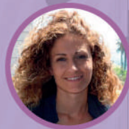
Ainoa Quiñones Montellano

13.00h CLAUSURA : Ainoa Quiñones Montellano, delegada del Gobierno en Cantabria.